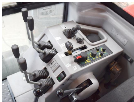
Пульт управления EHR на серийном тракторе

а, б, в – высотный, позиционный, силовой способы: M_{дн} , M_{с.ср} – номинальный момент двигателя и средний момент сопротивления; h – требуемая глубина обработки; R – сила сопротивления орудия, M_{кр} – крутящий момент относительно точки O , R' – реакция в верхней тяге