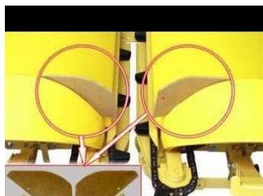
5. Комплект резиновых дефлекторов