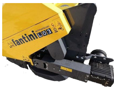
1. Редукторная система привода