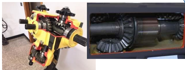
2. Редуктора с системой защиты