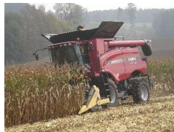
6. Скорость уборки 12 км/ч и это не предел