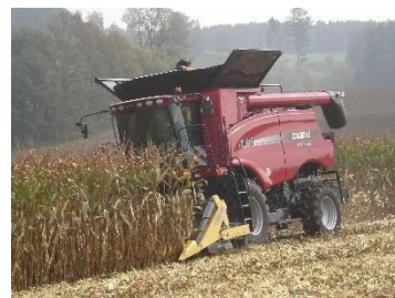
6. Скорость уборки 12 км/ч и это не предел